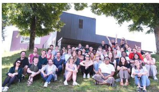
Gerموir 2024, 29 & 30 juin, lycée Charles Péguy à Gorges (44).

Le Gerموir est le rendez-vous annuel du mouvement e-graine, qui réunit l'ensemble des permanent-es et dirigeant-es bénévoles des associations et des organisations spécialisées. Ce moment clé de la vie de notre mouvement est l'occasion de se rencontrer, se retrouver, de questionner nos choix dans le mouvement, de débattre de multiples propositions, de célébrer les succès de l'année écoulée et même de rêver. La mobilisation citoyenne a été le fil rouge de ces 2 jours de travail qui ont réuni 74 personnes.