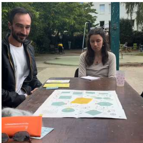
Animation des "2030 glorieuses" lors du Festival des Transitions

L'arrivée de l'été est une invitation à rêver ensemble d'un futur désirable et joyeux . Alors cette année pour les apéros utopiques, en juin, nous avons organisé une après-midi de rencontre et d'échange avec l'association PACCO à la Générale, pour prendre de la hauteur sur les enjeux sociétaux et créer un réel moment de convivialité.