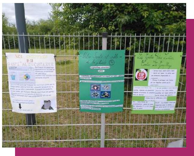
Une campagne d'affichage de sensibilisation préparé par les élèves du collège Anne de Bretagne