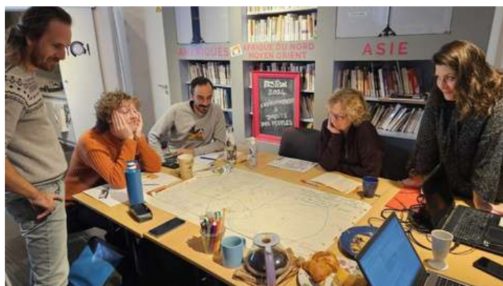
Grandes réflexions pour le chantier stratégie, dans les locaux de la MCM