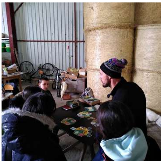
Sensibilisation au commerce équitable pendant la visite de la ferme de BelAir

Du 5 au 26 mai, nous avons co-organisé, avec le CCFD-Terre Solidaire et Artisans du monde, la Quinzaine du commerce équitable.