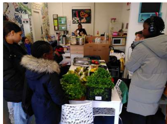
La prise de son avec Pop Média, à la rencontre des alternatives du quartier.