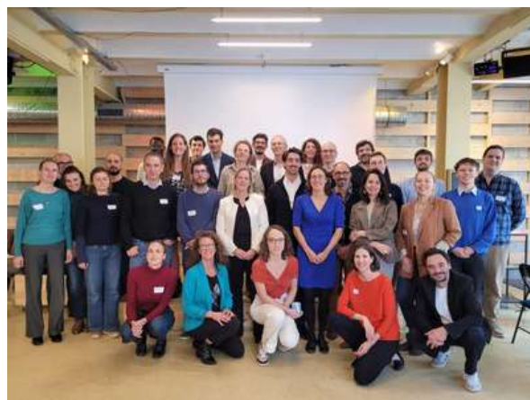
Les partenaires du programme Watt Watchers Paris, le 1er octobre 2024

Le 1er octobre, e-graine et les membres du consortium ont participé au lancement officiel du programme à Paris, réunissant l'ensemble des copilotes et partenaires du programme. Une journée placée sous le signe de la coopération, conclue par le discours d'Olga Givernet, ministre déléguée en charge de l'énergie, qui a insisté sur le fait que la " sobriété est l'une des clés de la réussite de la transition énergétique ".