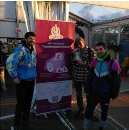
Stand à l'Autre Marché de Noël