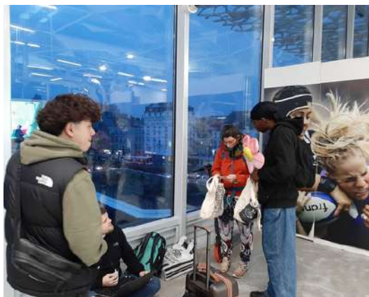
Sensibilisation à la gare de Nantes