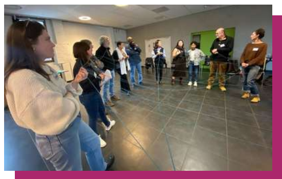
Réunion des acteurs du territoire sur la thématique des migrations