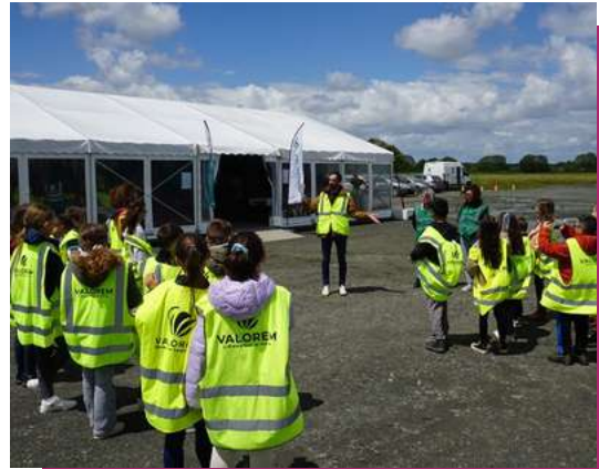
Une animation au pied des éoliennes

Valorem a fait appel aux animations d'e-graine sur les différentes sources d'énergies, consommation énergétique dans le quotidien et les éco-gestes à mettre en place. Quelques animations ont ainsi pu être mises en place auprès de classes qui venaient visiter des parcs éoliens.