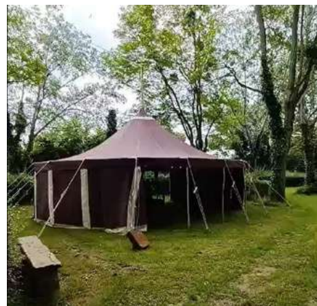
L'exposition sous chapiteau au tiers lieu AGIS à Mûrs-Erignés

L'exposition a été affichée à Mûrs-Erignés pendant un mois. Une inauguration a été organisée pour se faire connaître et mieux appréhender la complémentarité que nous pouvons apporter. Elu·es, citoyen·nes, acteurs associatif étaient présent·es.