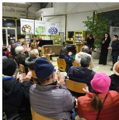
Soirée débat théâtre d'improvisation le 21 novembre, à Scopéli

Enfin, Scopéli, le supermarché coopératif de Rezé, nous a accueilli pour un évènement, initialement prévu pour la Quinzaine en mai. Une soirée débat et théâtre d'improvisation sur la consommation responsable avec la troupe La Lina. Nos partenaires de la Quinzaine étaient également présents : Artisans du Monde et le CCFD.